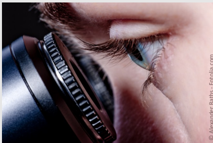
Wurzelbehandlung mit Hilfe des Mikroskops: Bis zu 25-fache Vergrößerung ermöglicht exaktere Arbeiten und bessere Ergebnisse.

Wurzelkanäle sind nur wenige Zehntelmillimeter dünn. Sie können Verästelungen, Krümmungen oder Stufen haben. Mit bloßem Auge sind solche Feinheiten nicht erkennbar. Deshalb werden sie leider oft übersehen.